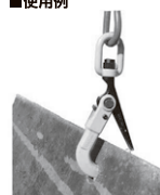
●敷鉄板の敷設・撤去作業